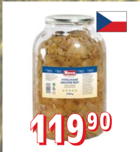
JABLKA STERIL. ŘEZY 4 l