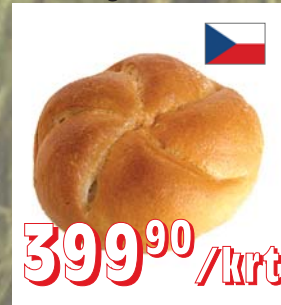
RAŽENKA NATURAL RAŽENKA CEREÁLNÍ 75 g, 70 ks/krt