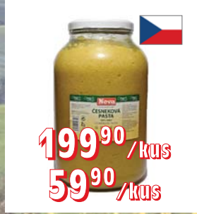
ČESNEKOVÁ PASTA 4 l 0,7 l