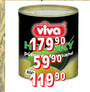
HRUŠKY STERIL. – loupané půlené 2 650 g – loupané 24 × 820 ml – kostky ve skle 4 l