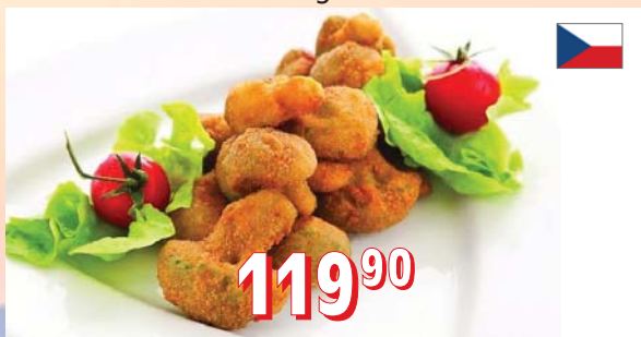
OBALOVANÁ BROKOLICE 5 kg/krt