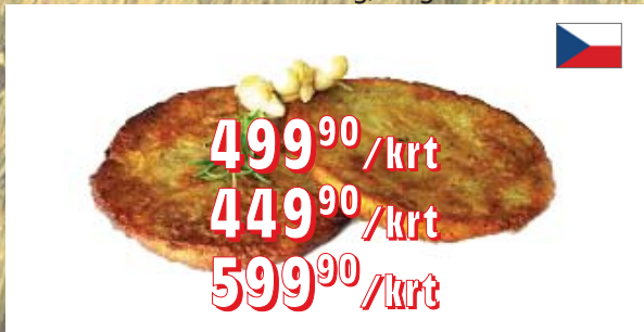
BRAMBORÁKY ČR – 20 × 200 g – kapsa – 60 × 60 g, 3,6 kg – 100 × 40 g, 4 kg