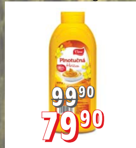
HOŘČICE VIVA 8 × 900 g