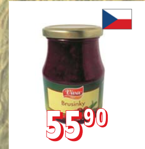
BRUSINKY STERILOVANÉ 12 × 400 g