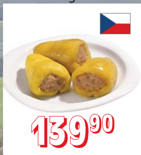
PLNĚNÁ PAPIKA 170 g/ks, 5 kg/krt