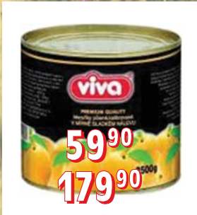
MERUŇKY STERIL. PŮLENÉ 12 × 820 ml 6 × 2 650 ml