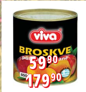
BROSKVE STERIL. LOUPANÉ PŮLENÉ 24 × 820 ml 6 × 2 650 ml