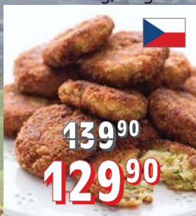
KARBANÁTKY ZELENINOVÉ 100 × 50 g, 5 kg/krt