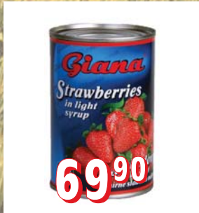
JAHODY STERILOVANÉ 12 × 820 ml