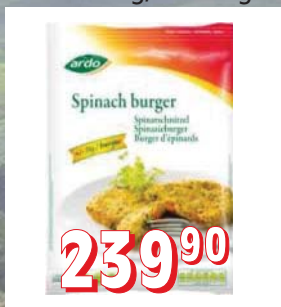
ŠPENÁTOVO-SÝROVÉ ŘÍZEČKY 10 × 1 kg, kus 75 g