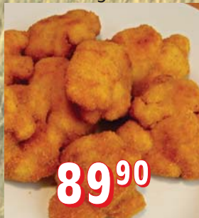
OBALOVANÝ KVĚTÁK 5 kg/krt