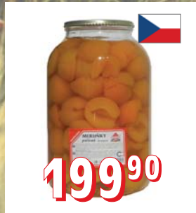
MERUŇKY STERILOVANÉ – PŮLENÉ 4 l – PŮLENÉ DIA 4 l