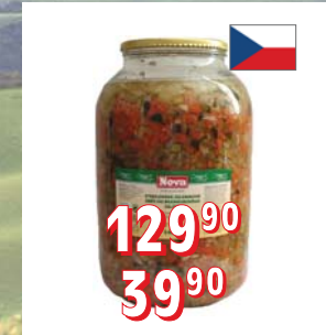
STERILOVANÁ SMĚŠ DO BRAMBOR. SALÁTU 4 l