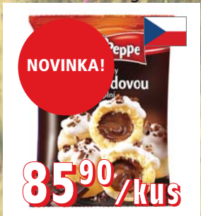
TVAROHOVÉ KNEDLÍKY PLNĚNÉ ČOKOLÁDOU 8 × 600 g