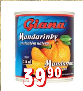
MANDARINKY STERILOVANÉ 24 × 314 ml