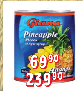
ANANAS KOUSKY STERILOVANÝ 24 × 820 ml 3 000 g