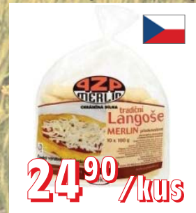
LANGOŠE MRAŽENÉ 10 × 100 g, krt 6 × 1 kg