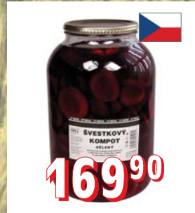
ŠVESTKY STERIL. – PŮLENÉ – PŮLENÉ DIA 4 l