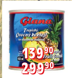
OVOCNÝ KOKTEJL STERIL. 12 × 850 ml 2 500 g, 6 ks