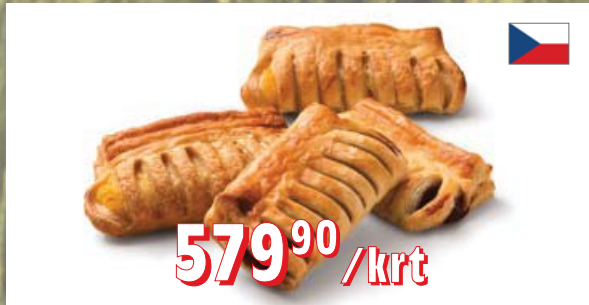
HŘEBEN TVAROH, OŘECH, MERUŇKA, PUDING 80 × 65 g, 5,2 kg/krt