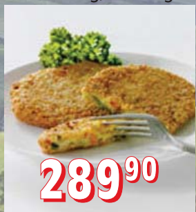
KVĚTÁKOVO-SÝROVÉ ŘÍZEČKY 10 × 1 kg, kus 75 g