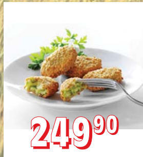
BROKOLICOVÉ NUGETY ARDO 6 × 1 kg