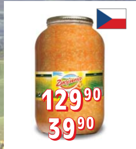
STERIL. ZÁKLAD NA SVÍČ. OMÁČKU (HALALI) 4 l