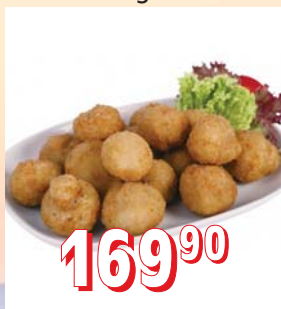
OBALOVANÉ ŽAMPIONY 5 kg/krt