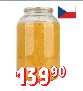
DÝŇE KOSTKA 4 l

Country mix steak 800 g, 317 90 Adamova žebra medová 900 g, 249 90 Nové koření, dóza 450 g, 269 90 Jalovec celý 400 g, 239 90 Směs na ryby 1000 g, 529,- Bobkový list 70 g, 99 90 Školní jemné koření 1000 g, 299,- Majoránka 500 g, 219 90 Gurmetka hrubá 1100 g, 209 90