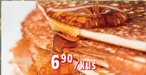
PALAČINKY 100 × 50 g, 5 kg/krt