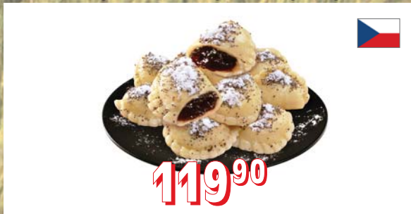
TAŠTIČKY S NÁPLNÍ MRAŽENÉ nepředvařené, jahodové, povidlové, tvarohové (4,5 kg/krt), 55 × 18 g, 6 × 1 kg, 6 kg/krt