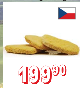
OBALOVANÝ SÝR nedrcený, nepředsmáží. 40 × 100 g, 4 kg/krt 40 × 130 g, 5,2 kg/krt