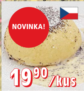
KYNUTÉ KNEDLÍKY S POVIDLY 24 × 170 g, 4 kg/krt