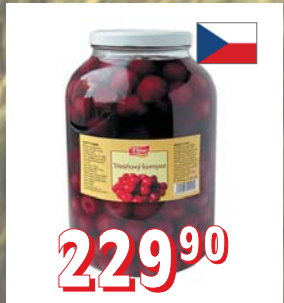
STERILOVANÉ TŘEŠNĚ bez pecek, 4 l