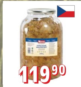
JABLKA STERIL. KOSTKY 4 l