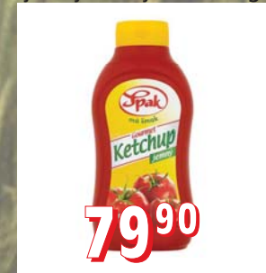
KEČUP SPAK jemný / ostrý, 6 × 900 g