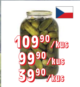
OKURKY 7–9 cm, 4 l 9–12 cm, 4 l 720 g